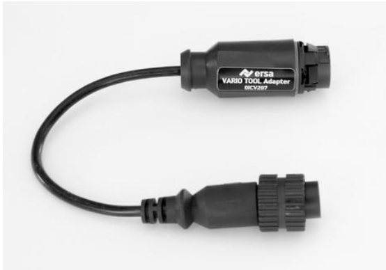
Abbildung / Figure 1: VARIO TOOL Adapter

Der Ersä VARIO TOOL Adapter (Abb. 1) wurde für die Ersä Löt- und Entlötstationen i-CON VARIO 2 und i-CON VARIO 4 entwickelt, um weitere Löt- und Entlötwerkzeuge am Anschluss A2 (Abb 2) der Lötstationen zu betreiben. Am Anschluss A2 wird in der Regel der i-TOOL AIR S oder der i-TOOL HP betrieben. Mit dem Adapter können folgende Werkzeuge angeschlossen werden: